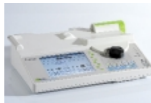
Base Intensiva: Función exclusiva de 2 canales relevo, biblioteca de drogas e historial. Ideal para cualquier práctica clínica.

Para más detalles: baseprimea@fresenius-hemocare.com