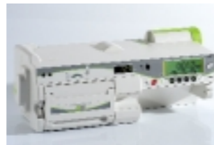
Módulo MVP: Bomba volumétrica