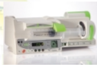
Módulo DPS: Bomba de jeringa

Portátiles y fáciles de usar, los productos Orchestra están diseñados para cubrir correctamente las necesidades en UCI y quirófano.