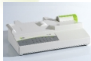
Base A: Alimentación y comunicación centralizada hasta 8 módulos de infusión